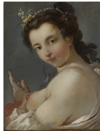
Charles-Joseph NATOIRE (1700-1770) Jeune Femme en buste, dite La Mutine vers 1730-1735 huile sur toile inv. 1938 F 790