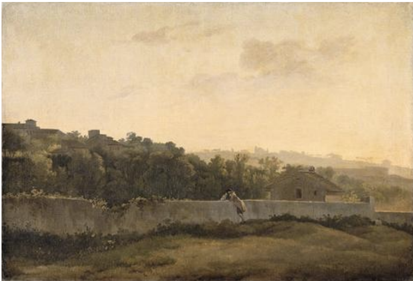
Jean-Pierre HOUËL (1735-1813) Paysage, effet de soir tombant huile sur toile inv. 1938 F 725