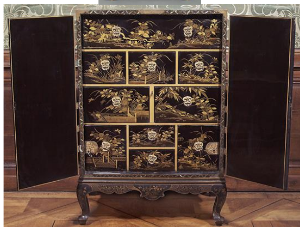
3 - Japon, XVIII e -XIX e siècle Coffre bois, laque, incrustations de nacre et bronze doré inv. 1938 Mob 36