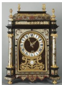
2 - France, fin du XVII e siècle Pendule bronze, cuivre, ébène, écaille, étain, marqueterie Boulle, noyer inv. 1938 O 2