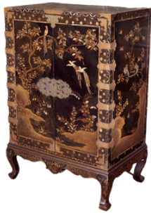
3 - Japon, XVIIIe-XIXe siècles Coffre , bois laqué, incrustations de nacre et bronze doré, inv. 1938 MOB 36