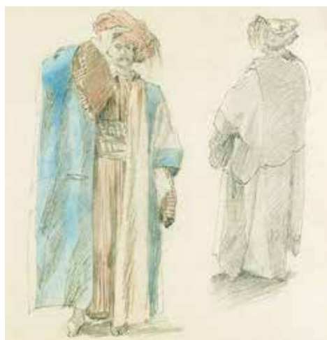
Adrien Dauzats, Études de personnage en costume oriental (détail), crayon graphite et aquarelle, Dijon, musée Magnin

Tarif : 15€ / 12€ (sur présentation d'un justificatif)