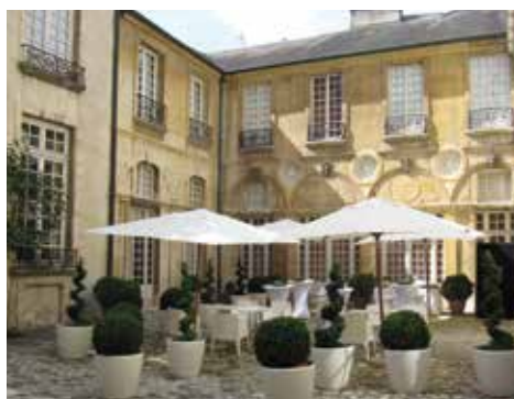
La cour intérieure lors d'une manifestation, musée Magnin