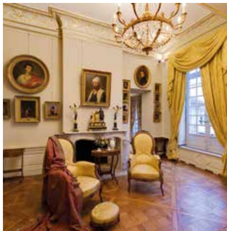
Salon doré, musée Magnin

03 80 74 53 11, et par courriel : lesamisdesmuseesdedijon@orange.fr