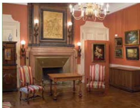
Salon Hercule, musée Magnin