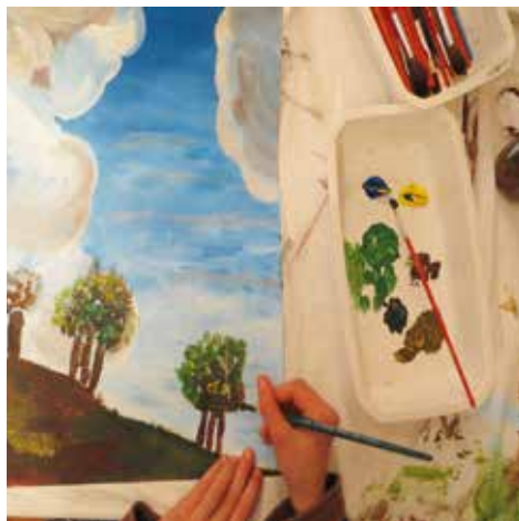
Atelier au musée Magnin

Attention : les jauges étant limitées, nous vous invitons à réserver vos places pour les visites, les événements et les concerts.