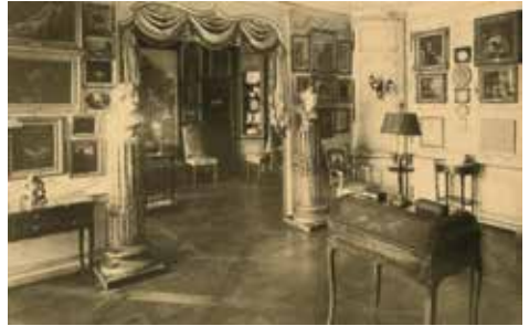
Une salle du musée Magnin en 1938, photographie, Dijon, musée Magnin