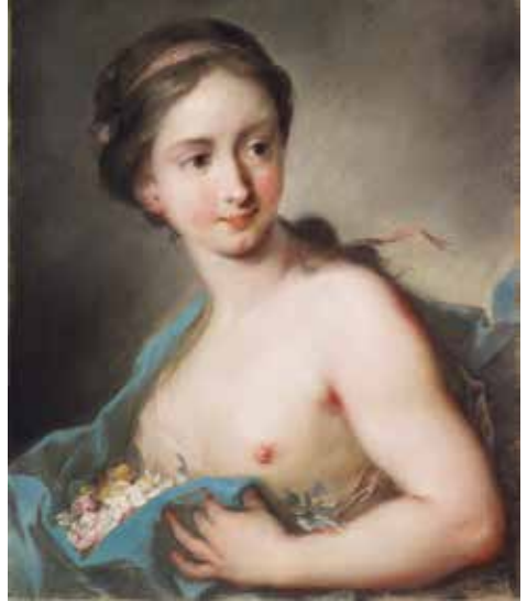
Rosalba Carriera, Le Printemps, 1720-1721, pastel, Dijon, musée des beaux-arts