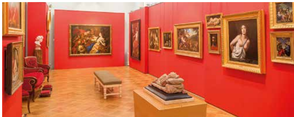
La salle italienne, musée Magnin

Renseignements : 03 80 67 11 10 ou communication.magnin@culture.gouv.fr